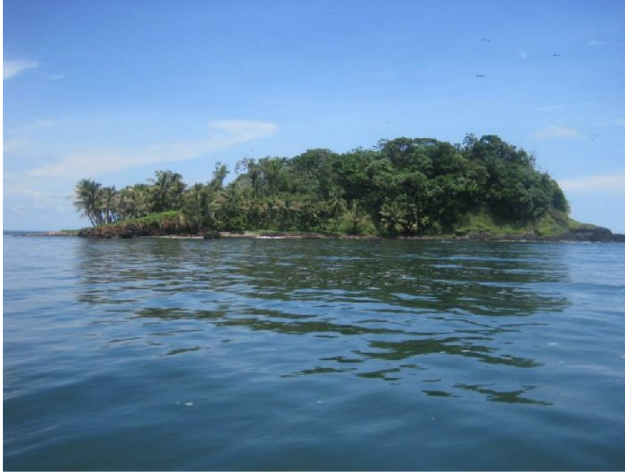
Foto: cayo frances, en el mar Caribe

En el cayo se puede pescar y hacer snorkel